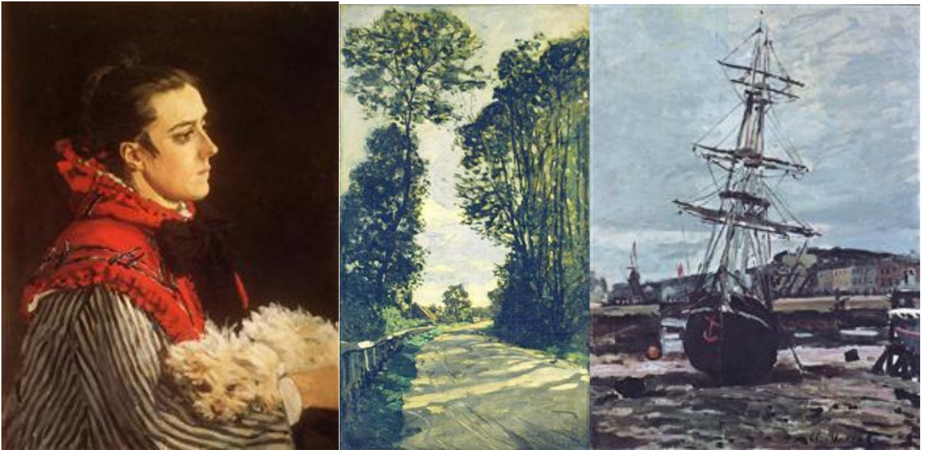
(retrato de Camille y paisajes anteriores a 1870)

Hasta 1870 Claude Monet fue muy influido por la obra de los pintores realistas Corot y Courbet :