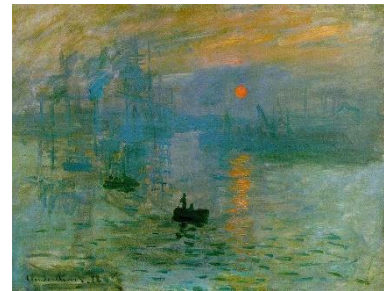
Impresión sol naciente ", expuesta en 1874

De vuelta a Francia en 1871 se establece en Argenteuil hasta 1878 y en los paisajes de esta etapa sienta las bases del movimiento impresionista. En 1874 crea, junto con otros pintores, la Sociedad Anónima Cooperativa de Artistas Pintores, Grabadores y Escultores y fue precisamente esta cooperativa la que organizó y protagonizó la famosa exposición en las salas del fotógrafo Nadar, donde Monet presenta su cuadro " Impresión sol naciente " cuya historia todos conocen, junto con obras de Sisley, Renoir, Cezanne, Boudin, Pissarro, Berthe Morisot y probablemente muchos más, recibiendo las desdeñosas críticas ya comentadas, es el crítico de arte Louis Leroy quien acuña el término impresionistas usándolo despectivamente, pero Monet y sus amigos lo encuentran apropiado y lo adoptan, nacen los "impresionistas". Otros cuadros de esta época son su serie sobre la estación de San Lázaro .