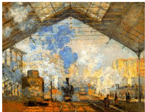
" La Estación de San Lázaro ", 1877