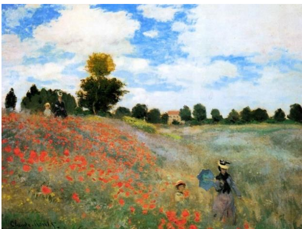
" Campo de Amapolas ", 1873