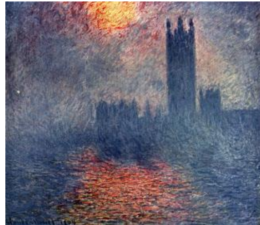
Monet: " Parlamento de Londres " (1900-1904)