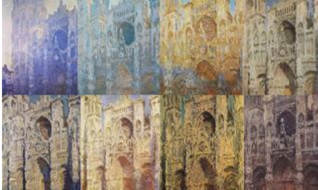
"La catedral de Rouen", 1892

A partir de 1890 vive definitivamente en Giverny (compra la casa). Pinta su famosa serie obre la catedral de Rouen a diferentes horas del día y repite una y otra vez hasta su muerte cuadros de los nenúfares que veía cerca de su casa. Sus últimos años son difíciles como consecuencia de graves problemas de vista y depresión