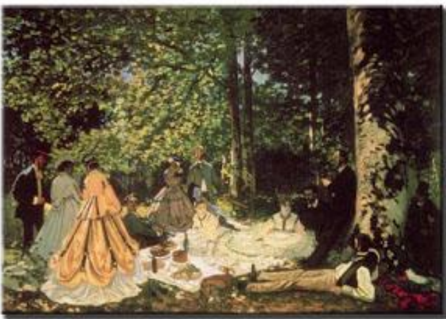
Monet: "Mujeres en el jardín" (1866)

Tales influencias se aprecian en unos paisajes con pocos matices de color y escenas grupales que recuerdan El desayuno en la hierba de Manet: El desayuno , Mujeres en el jardín .