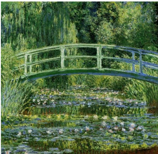
"Puente Japonés", 1899

Se observa como la influencia de la diferente iluminación bien por cambios horarios o por efectos atmosféricos es capaz de transformar la impresión del objeto, de los elementos reales o de los elementos de la naturaleza.