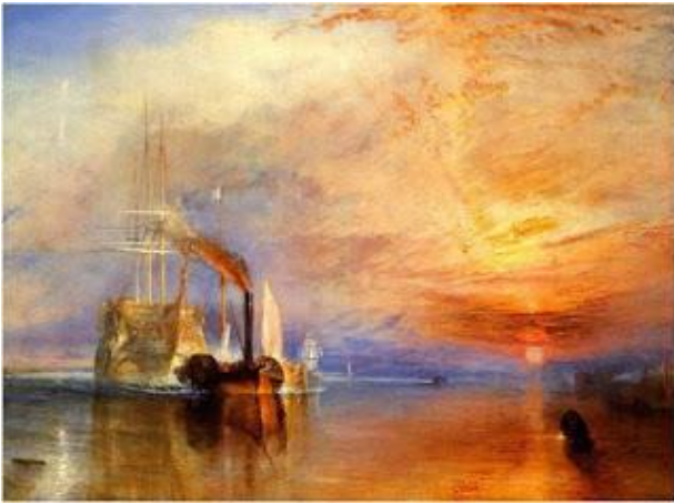
Turner: " El temerario luchando " (1838)

Debido a la guerra Franco-Prusiana se estableció por una temporada en Londres . Allí conoció la obra de Turner y decidió volcarse sobre el paisaje y captar los estados atmosféricos. su paleta también se trasforma con colores brillantes y puros. Sin embargo, no solo creó obras sobre Londres durante este año, sino que esta ciudad le inspiró en otras épocas como por ejemplo " El parlamento de Londres " que fue pintada entre 1900 y 1904.