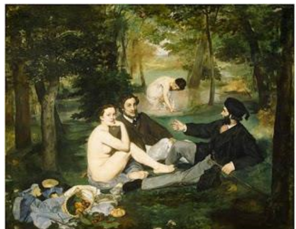
Manet: "Desayuno en la hierba " (1863)