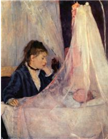
La Cuna, 1872