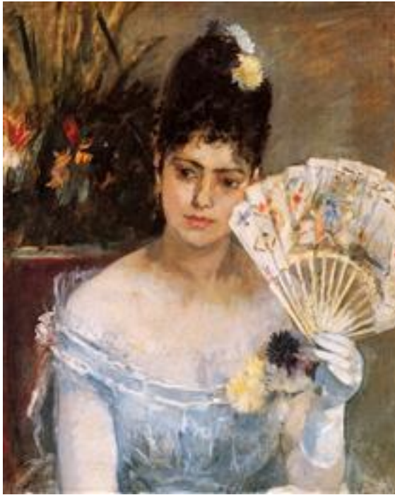
En el Baile, 1875

Desde entonces Manet y Morisot mantuvieron una estrecha relación artística durante el resto de sus vidas, que aumentó tras el matrimonio de Berthe con Eugène.