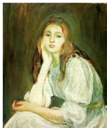
Julie soñando despierta, 1894

Murió en París, con sólo cincuenta y cuatro años, el 2 de marzo de 1895, está enterrada en el cementerio de Passy de París.