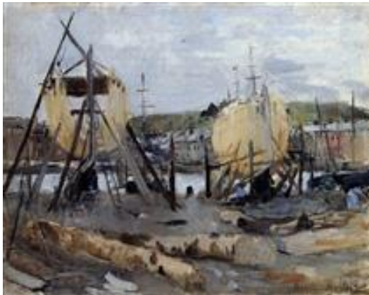
Barcas en construcción, 1874