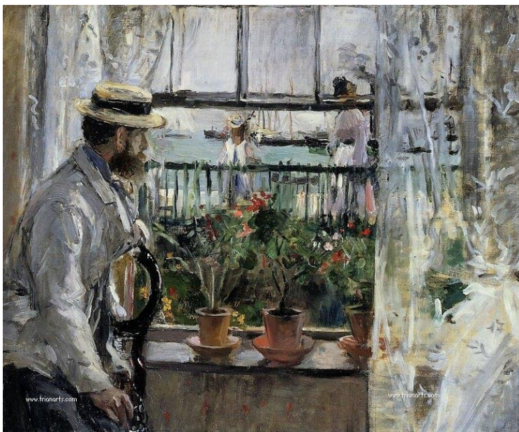
Manet en la Isla de Wight, 1875

En 1868 hizo amistad con Edouard Manet y a través de él, conoció a su hermano Eugène, con el que se casó en 1874.