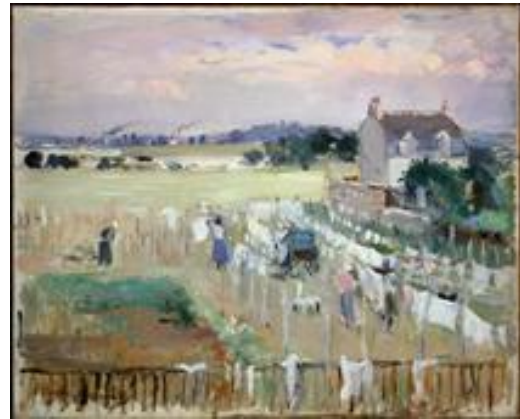
Tendiendo la ropa para secar, 1875

En 1868 hizo amistad con Edouard Manet y a través de él, conoció a su hermano Eugène, con el que se casó en 1874.