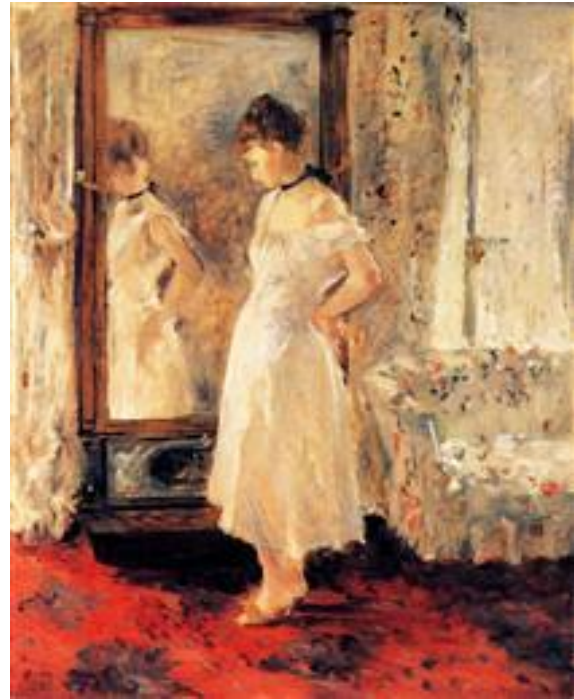
El Espejo (Psiqué), 1876

Berthe, junto a Camille Pissarro, fueron los dos pintores que expusieron en todas las exhibiciones impresionistas. Sólo una dolencia de su única hija provocó su ausencia en la exposición de 1879.