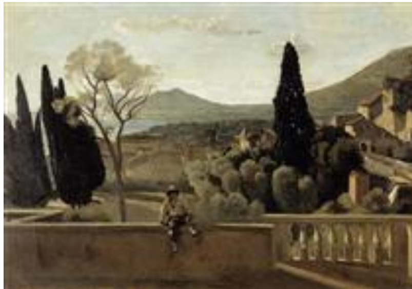
View of Tivoli (después de Corot), 1863

A su vez a Oudinot les presentó a Camille Corot, que junto a los pintores de la Escuela de Barbizon influyeron en ellas de forma determinante el resto de su carrera.