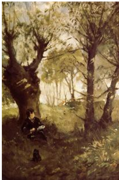
The old track to Auvers, 1863

En 1858 ambas hermanas entraron como copistas en el Louvre donde conocieron a Henri Fantin-Latour y a Félix Bracquemond . Fue gracias estos contactos comenzaron a recibir clases de Achille Oudinot, enseñanza que impartía saliendo a a pintar al aire libre.