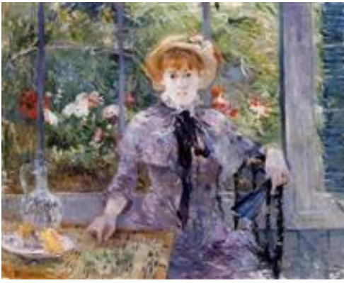
After Luncheon, 1881