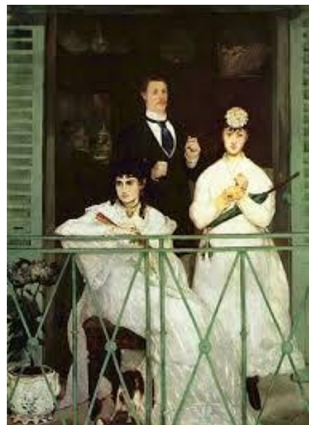
El Balcón, 1868-69